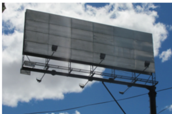
Foto 2. Texto de la Publicidad